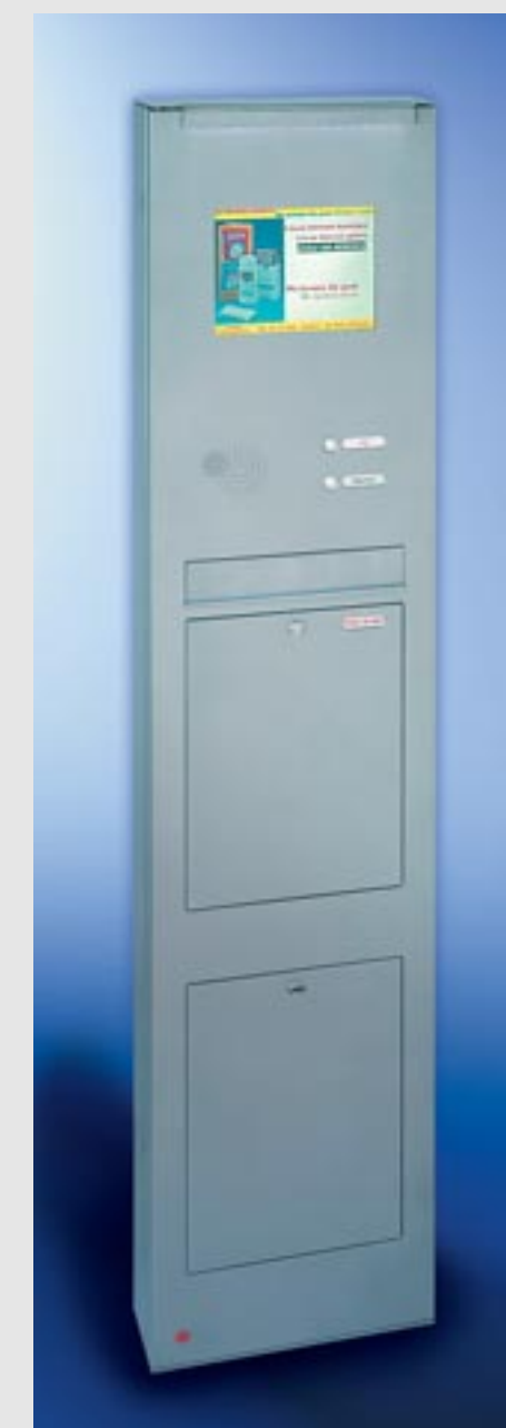
Linie commercial Stahl-Säule pulverbeschichtet, einteilige Briefkastenanlage, mit RS4 , Schrägeinwurf 335 x 50 mm, Kastenmaß 335 x 550 x 140 mm, Entnahmekipptüre 335 x 440 mm mit 2 Öffnungsbegrenzern, Depotfach mit Drehverschluss, LED-Beleuchtung, integriertes Farb-TFT-LCD-Display, Säulenhöhe 2000 mm, Säulentüre DIN rechts angeschlagen.