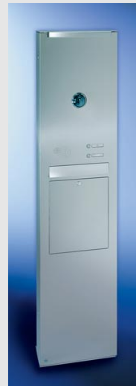
Linie commercial Edelstahl-Säule V4A, einteilige Briefkastenanlage, Schrägeinwurf 335 x 50 mm, XXL-Kastenmaß 335 x 770 x 140 mm, Entnahmekipptüre 335 x 440 mm mit 2 Öffnungsbegrenzern. Mit RS4 , LED-Beleuchtung, eingebaute Videokamera (bauseits gestellt), Säulenhöhe 2000 mm, Säulentüre DIN rechts angeschlagen.