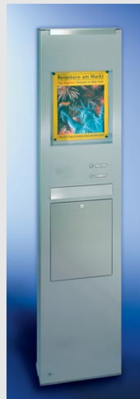
Linie commercial Edelstahl-Säule V4A, einteilige Briefkastenanlage, Schrägeinwurf 335 x 50 mm, XXL-Kastenmaß 335 x 770 x 140 mm, Entnahmekipptüre 335 x 440 mm mit 2 Öffnungsbegrenzern. Mit RS4 , LED-Beleuchtung, integrierter Mitteilungskasten mit Beleuchtung Sichtfläche 335 x 420 mm (für DIN A3), Säulenhöhe 2000 mm, Säulentüre DIN links angeschlagen.

Ob plakativ oder informativ. Die "Linie commercial" bietet attraktive Kommunikationsflächen in Augenhöhe. Von Firmenbeschriftung über Mitteilungstafel, bis hin zum Videodisplay. Zeigen Sie, was Sie zu sagen haben.