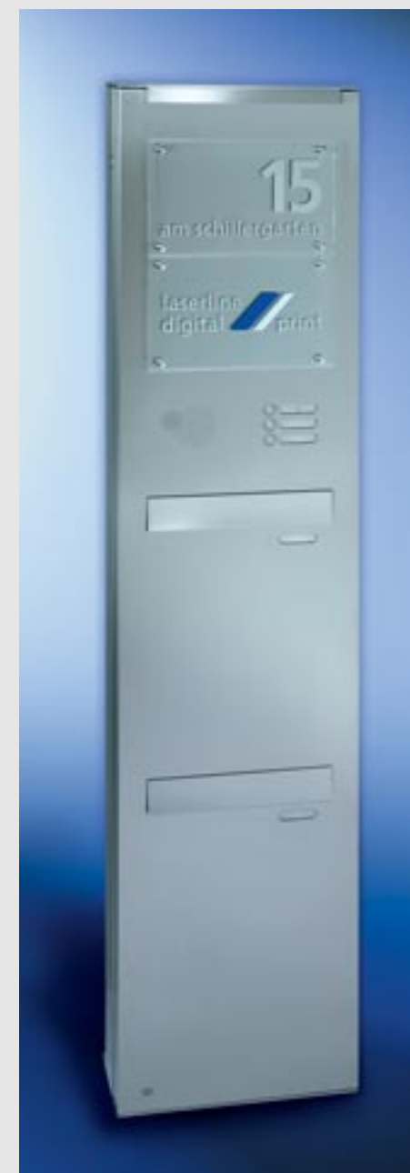
Linie commercial Edelstahl-Säule V4A, zweiteilige Durchwurfbriefkastenanlage, mit RS4 , Schrägeinwurf 335 x 50 mm, Kastenmaß 335 x 550 x 140 mm, Entnahmekipptüren 335 x 440 mm mit je 2 Öffnungsbegrenzern, LED-Beleuchtung, Acrylglasplatten 335 x 215 mm mit Folienbeschriftung, Säulenhöhe 2000 mm, Säulentüre DIN rechts angeschlagen.

Was bleibt, ist viel Raum für Ihre Ideen.