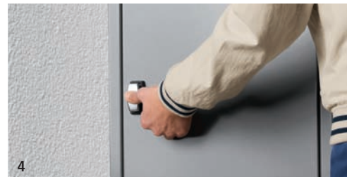
4 Er schließt die Tür, drückt den Drehgriff, und das Paket ist eingeschlossen.