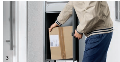
3 Er legt das Paket einfach in die Renz-Depotbox hinein.