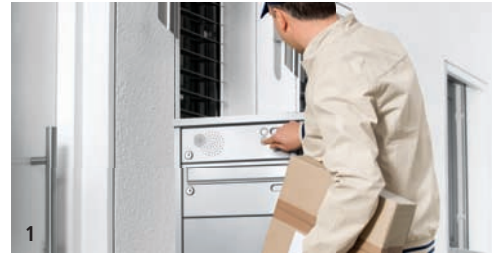
1 Der Paketzusteller kommt – aber Sie sind nicht zu Hause.

Die Renz-Depotbox funktioniert genial einfach.