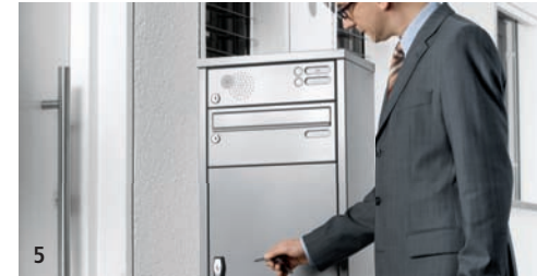
5 Sie kommen nach Hause und sehen die verschlossene Renz-Depotbox.