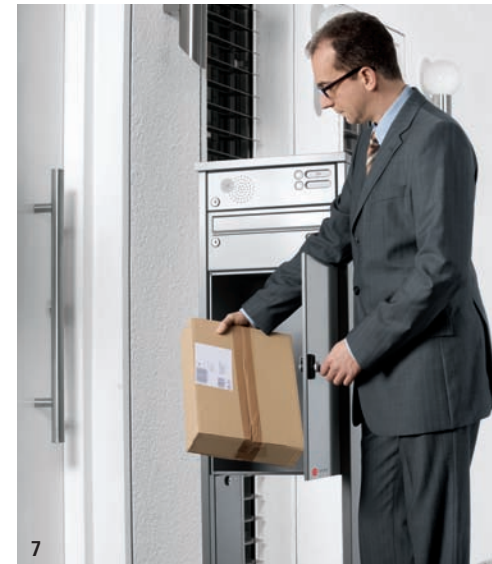
7 Und entnehmen Ihr Paket. Der nächste Zusteller kann kommen.