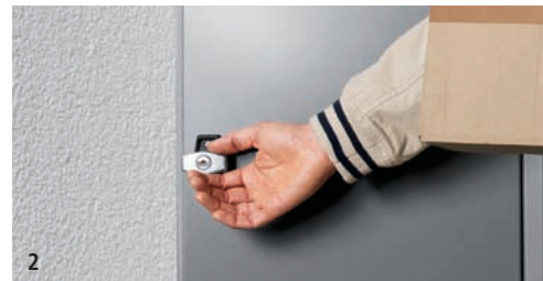
2 Der Zusteller kann die Tür ohne Schlüssel öffnen.