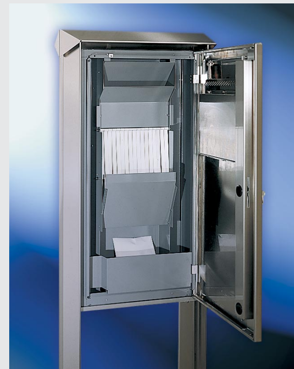
Sicherheitsfallschacht mit zwei beweglichen Rückholsperrn.

Um die Funktion des Fallschachtes zu gewährleisten sowie ausreichend Volumen zu bieten, sollten folgende Mindestgrößen unbedingt eingehalten werden: